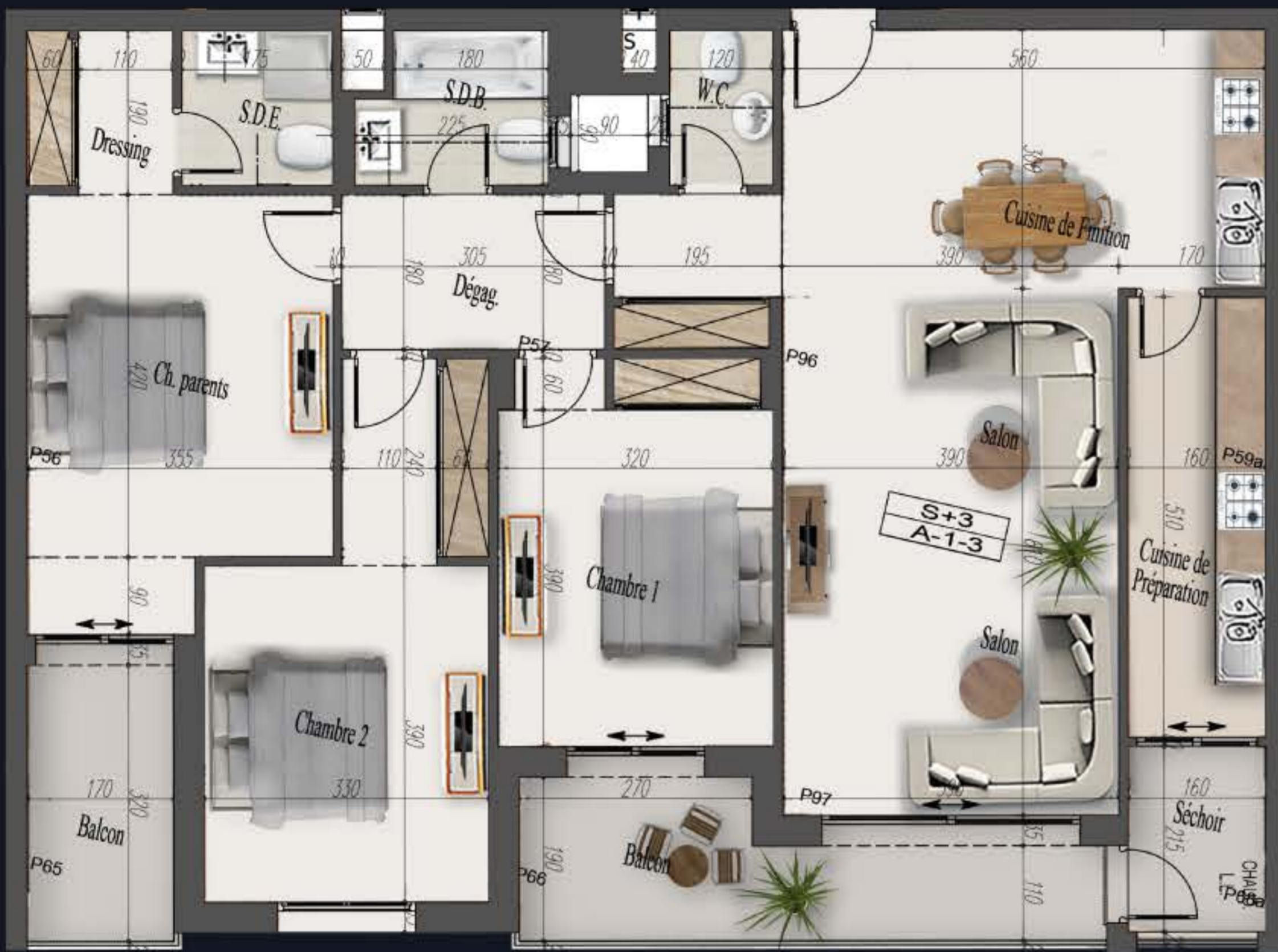
SURFACE: 181 M 2