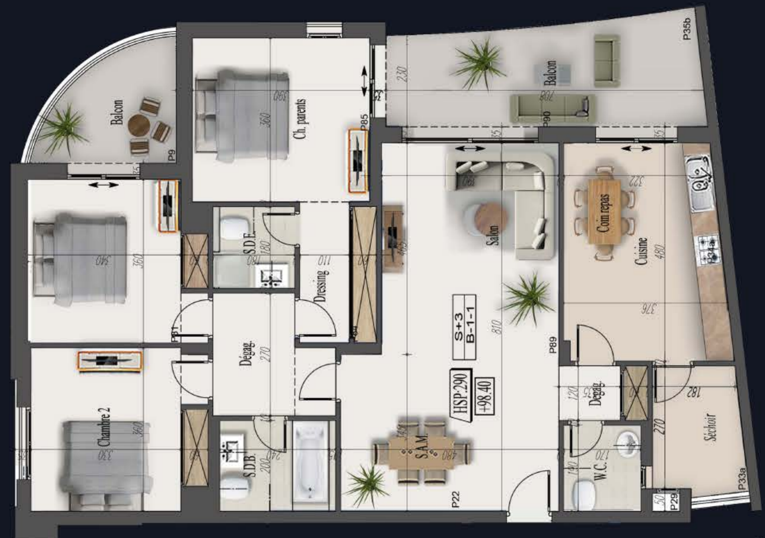
SURFACE: 193 M 2