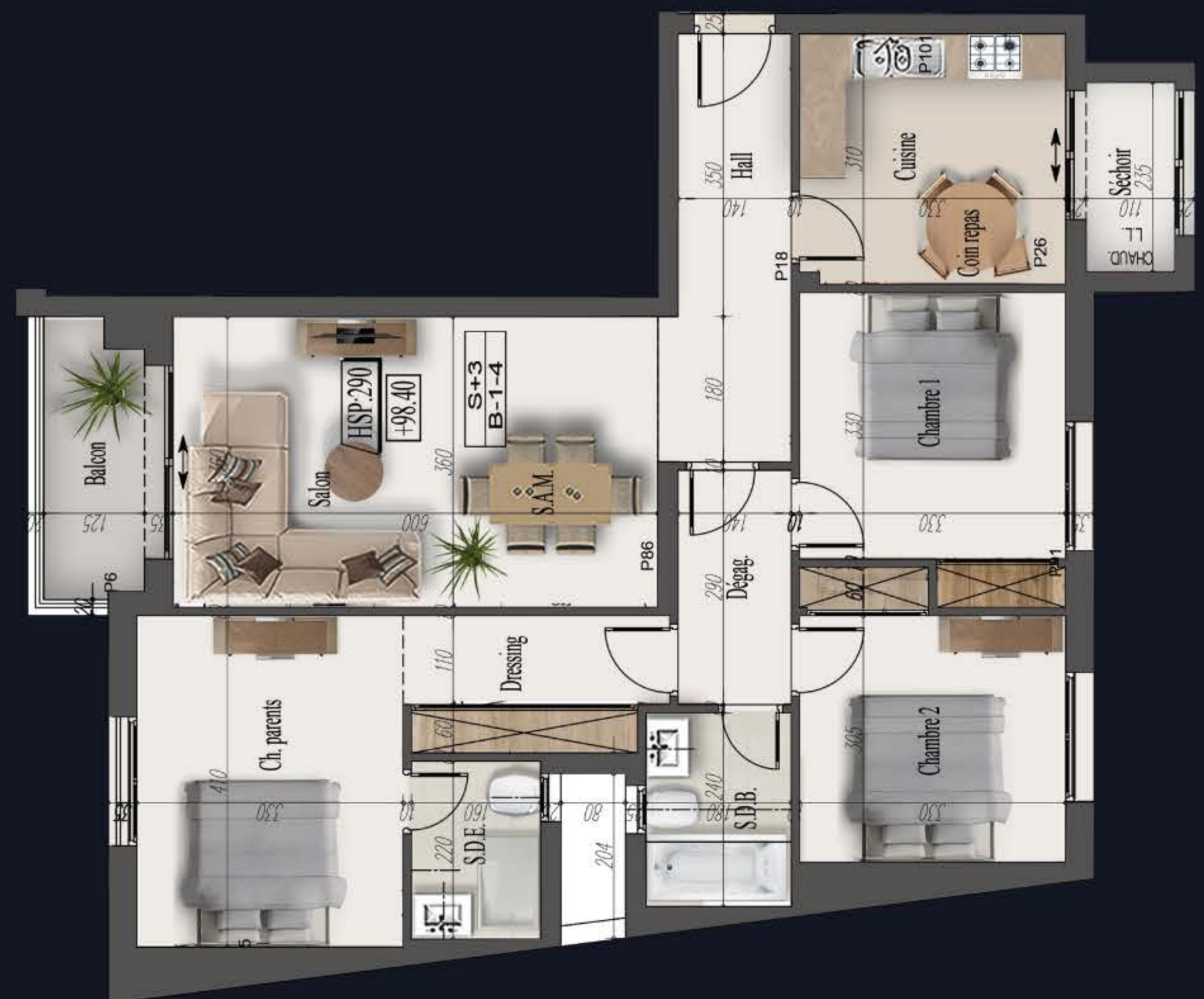
SURFACE: 136 M 2